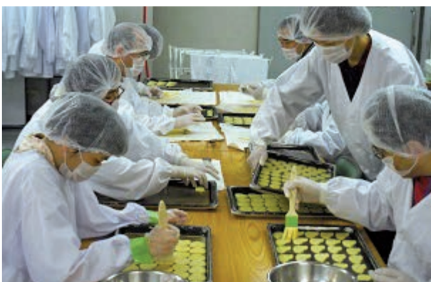
クッキー卵ぬりと型抜き作業

いた利用者から「接客するのは本当に楽しいです。」と頼もしい感想が聞こえました。利用者によるピアノコンサートも全ての公演が満員になりました。最後にボランティア様、ご家族様、地域の皆様にご協力をお願いしました。心より御礼申し上げます。(真野 陽介)