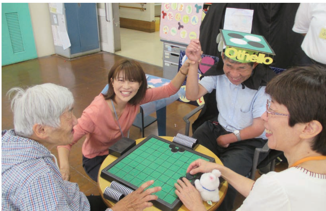
施設公開行事を開催しました(岡本福祉作業ホーム・泉の家)

一九七七年十二月三日第三種郵便物認可(毎月一、二、三、五、六、七の日十八回発行) 二〇一七年十一月六日発行(SSKP通巻六七四九号)