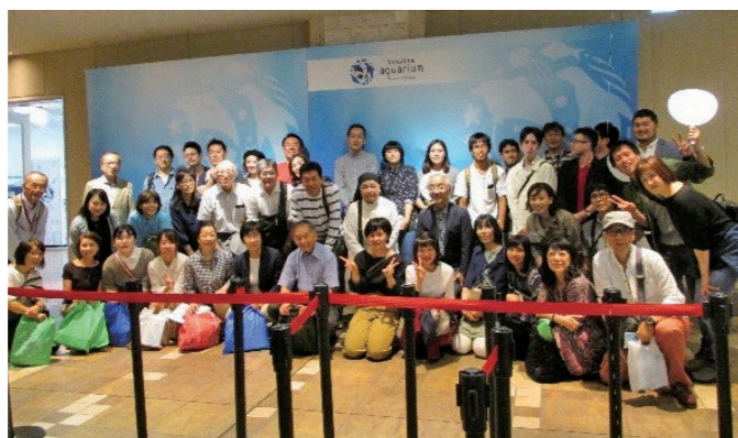
サンシャイン水族館の前で集合写真

も賑やかに過ぎました。会の終わりにはサックス演奏。演奏者の粋な計らいで全員で合唱をし、参加者が一体となって法人親睦会の幕を閉じました。 参加された方から「楽しかった」