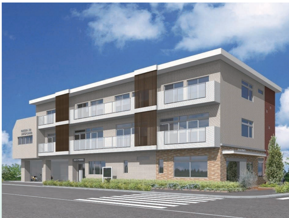
完成予想イメージ図 「設計・建築・監理：(株)新環境設計」 「建築工事：(株)今西組」

により（株）今西組と10月31日に工事業者契約を結ぶことができました。2017年11月1日より建築工事が着工し、2018年9月15日に建築工事竣工（予定）。その後、建築・消防設備などの確