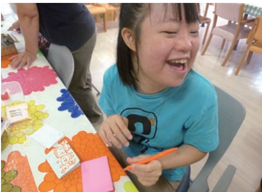
楽しい体験コーナー

閉会式では東京農業大学大道芸サークルに、ジャグリングと中国ゴマを披露していただき、