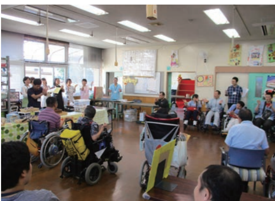
一本締めにて、笑顔でお開き!