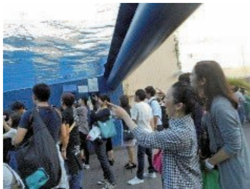
空飛ぶペンギン発見!

話をしたり、お土産コーナーで一緒に選んだり、普段なかなか接することのできない方たちと、話をする良いきっかけとなつたのではないのでしょうか。