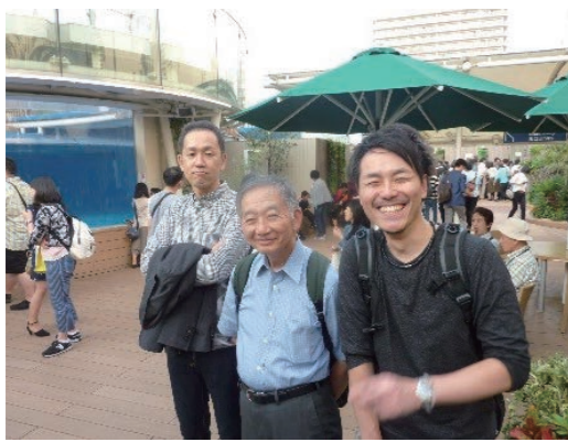
サンシャイン水族館にて

9月30日、秋らしいさわやかな昼下がり、法人親睦会がスタートしました。今年度は泉の家が担当をし、サンシャイン水族館とピアガーデンでの食事を企画しました。理事、監事、評議員の方たちもお招きし、各施設職員を合わせ47人が参加してくださいました。サンシャイン水族館は土曜ということもあり、家族連れや観光客で賑わっていましたが、水槽の魚について