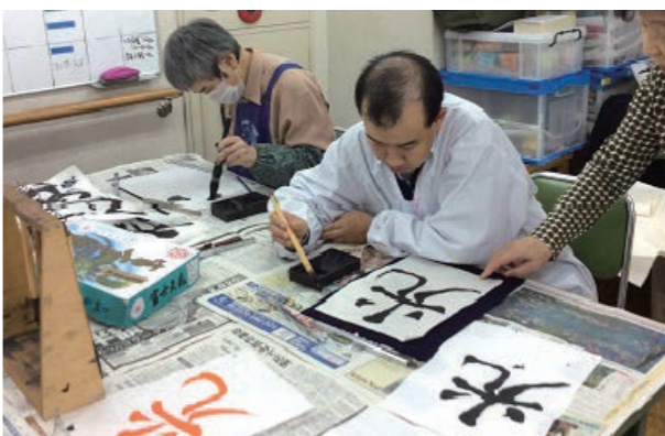
何回も書いて... どれにしましょう?