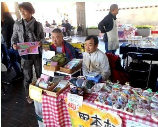
しんしょうひん 新商品「アート石けん」 えがら 絵柄もきれいですよ！

11月5日、世田谷区役所の「いきいきせたがや文化祭」に参加しました。 地域の方々の作品がたくさん出展され、その作品の素晴らしさに感動しまし た。他にもダンスや体験コーナーなど、大賑わい！