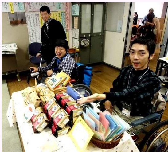
よこ りんしゅう 呼び込みの練習？