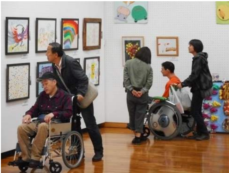
生活介護のみんなで芸術鑑賞

よく晴れた11月の中旬、世田谷美術館にて「世田谷区障害者施設アート展」が行われました。世田谷区内の多くの施設が出展し、芸術の秋らしく、数多くの作品が飾られていました。広いスペースで観る絵画は、ふだん施設の中で観るのとは違った雰囲気があり、とても良いものでした。