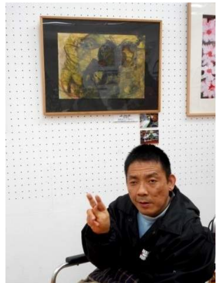
自分の作品の前でブイッ!