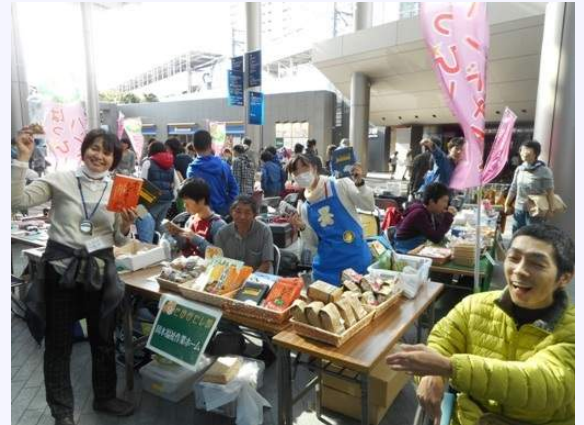
きょうふうにも負けず おおきなこえで販売しました

この日はとても風が強い日で、並べてい た商品が飛ばされることもありましたが、 岡本ホームの販売コーナーも予想以上に 売り上げが多くて驚きました。参加した 利用者さん達も、「本当にあの強風の中、 よくやったもんだ！」と言っていました。