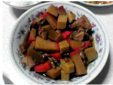
にいがたし じる いんようもと 新潟市の のっぺい汁