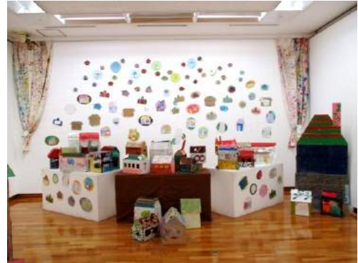
せいさく おかもと みんなで制作した「岡本タウン」