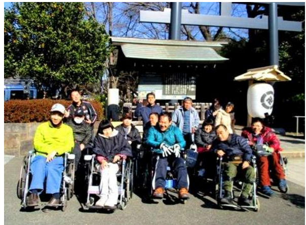
お天気に恵まれて 絶好のお出かけ日和