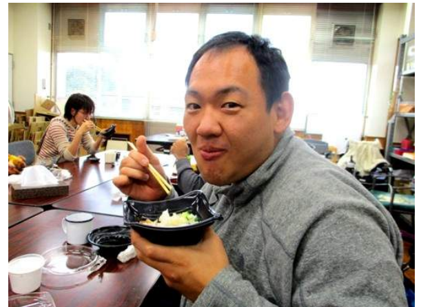
べんきょうかい 勉強会よりも しょくじ 食事のほうがメイン!?