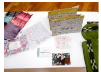
きもの かいが 着物、絵画、カレンダー、どれも力作です