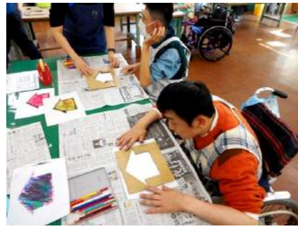
せいさく ようす 制作の様子