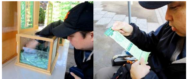
おみくじ引き 何が出るかな？