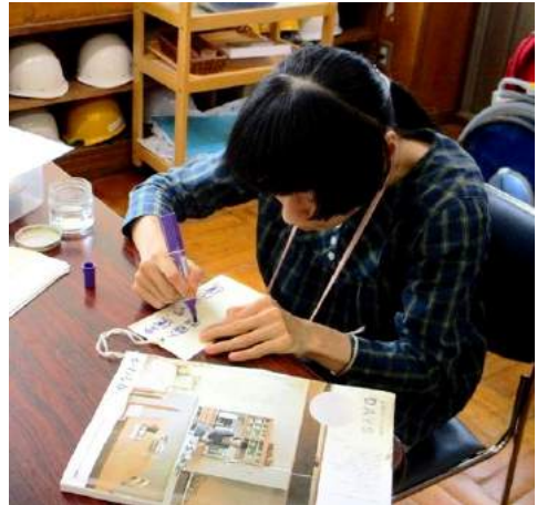
おも おも ねが か 思 い 思 い の 願 い を 書 い て