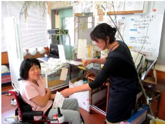
ささ たんざく かざ 笹 に 短 冊 を 飾 り 付 け