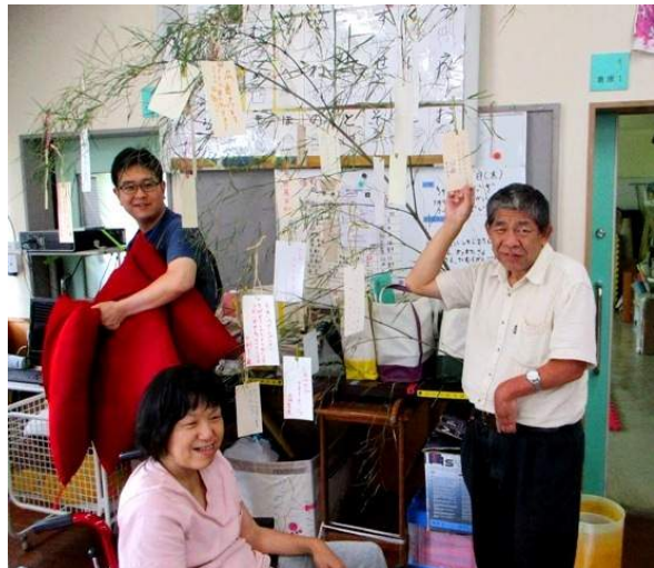
ねが かな み ん な の 願 い が 叶 う と い い ね