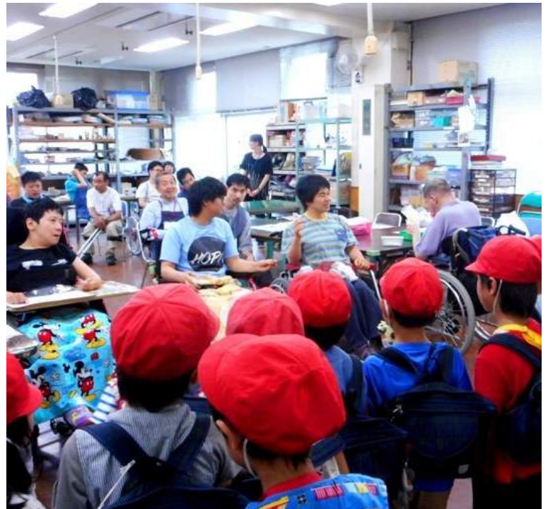
子ども達から お花と歌のプレゼント♪