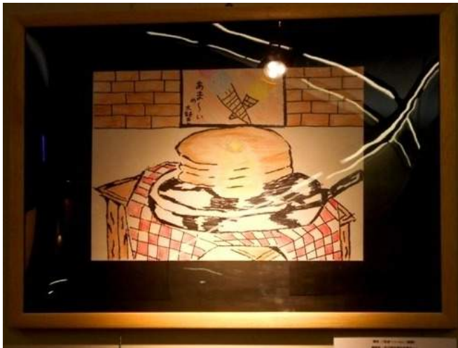
『あま〜〜〜い』 もりた しんいちろう 森田 慎一郎