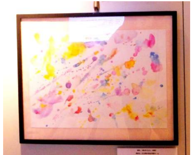
『結ばれる心』 むす ころ みどりかわ ゆうき 緑川 由希