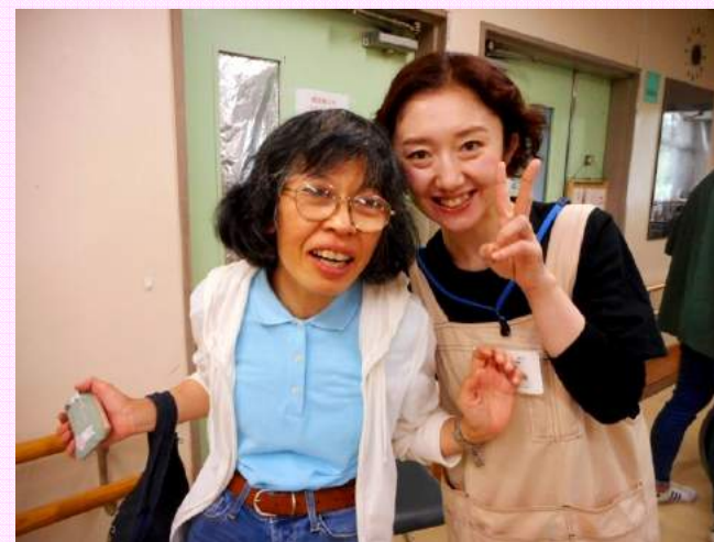
みんなも 笑顔満開！