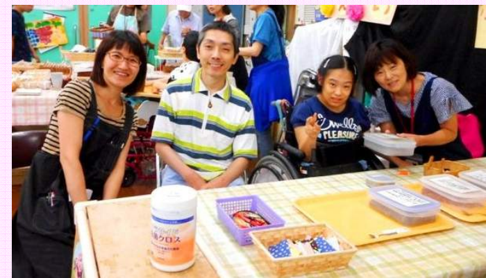
好きな香りを袋詰め ポップリ体験コーナー