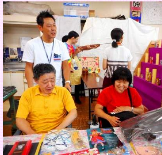
射的コーナー 当てて倒れたら景品ゲット！