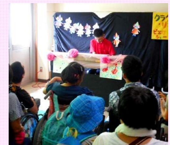
利用者さんのピアノ演奏

9月1日(土)、施設公開行事「まるごとおかもと」が開催されました。 当日は、雨が降ったり止んだりの曇り空でしたが、スタート直後から沢山の お客様が来て下さいました。各体験コーナーや販売コーナー、利用者さんによる ピアノショーなどがあり、コーナーは利用者さんが交代で担当しました。 今回初めて、ゲストに来ていただいた、クラウンリオさんのピエロショーは、 利用者さんもお客様も一緒に参加することができ、大変盛り上がりました。 事前準備も含め、利用者さんと職員、そしてご家族様、ボランティア様が 力を合わせ、とても楽しい一日となりました。