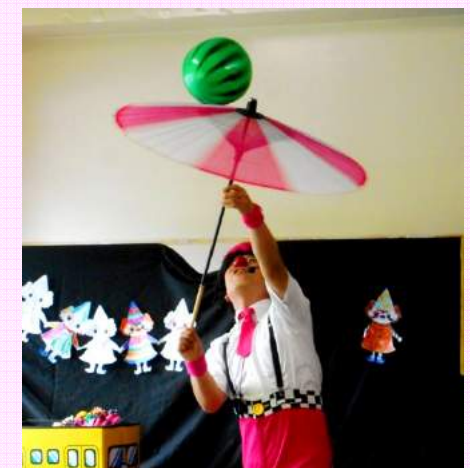
見事なプロの技 ピエロショー