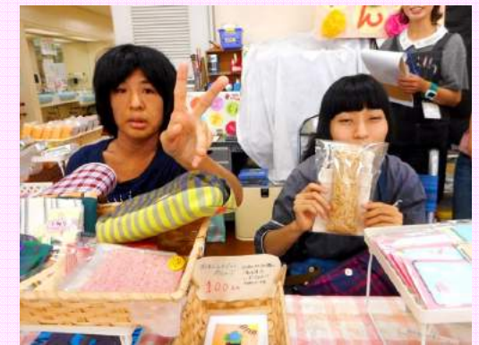
製品販売コーナーも大盛況！