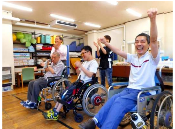
おかもと しょうさうせいせい 岡本は少数精鋭で しょうり みごと勝利!