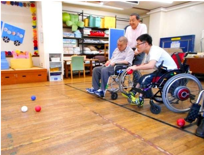
しろ まとだま 白い的玉に ちか 近づけられるかな