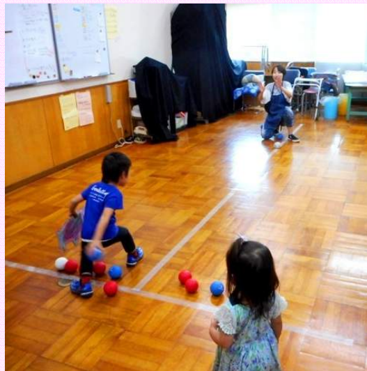
無料のボッチャコーナー うまくできたかな？