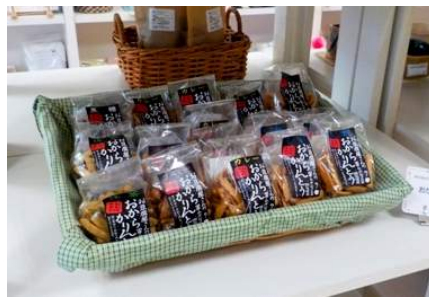
“かりんとう”をはじめ だいこうひょう みんな大好評！