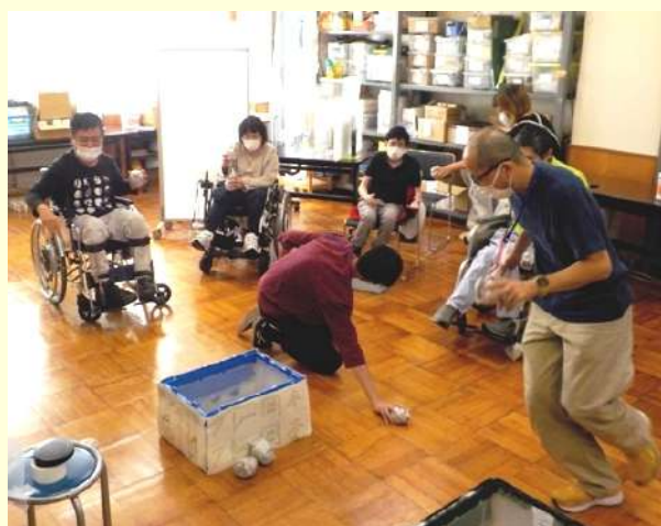
熱闘 玉入れ！ 職員は玉拾いで大忙し！