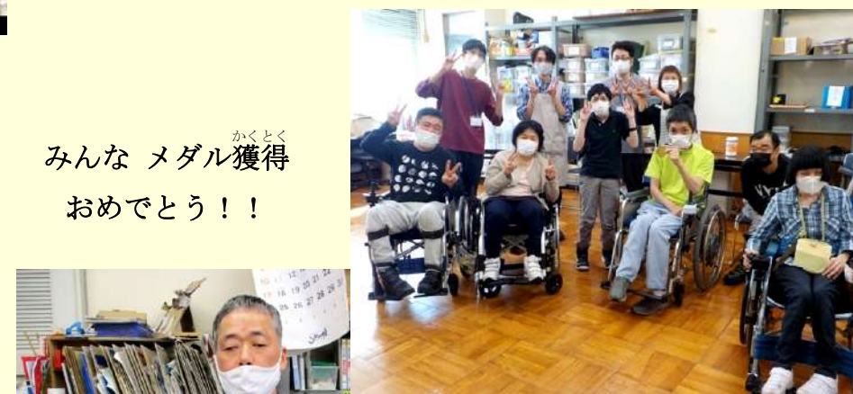
みんなメダル獲得 おめでとう！！