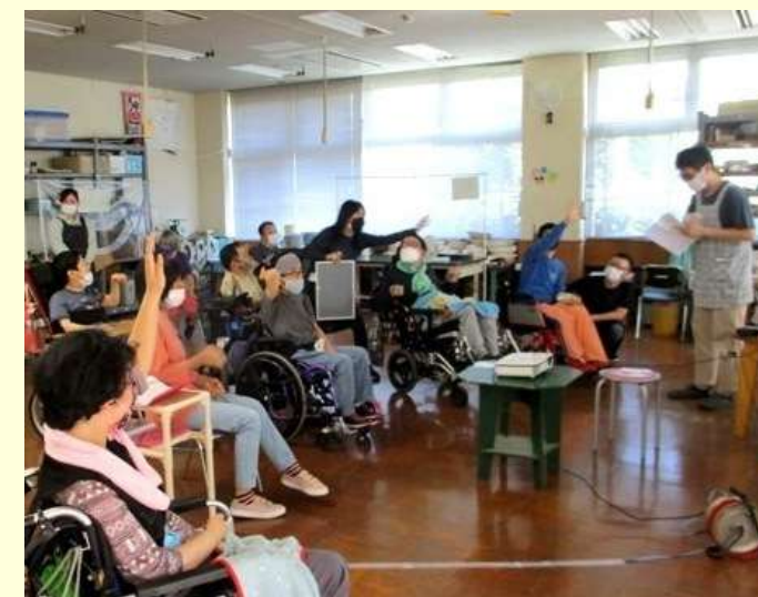
3択から答えを選んで… みんな正解！