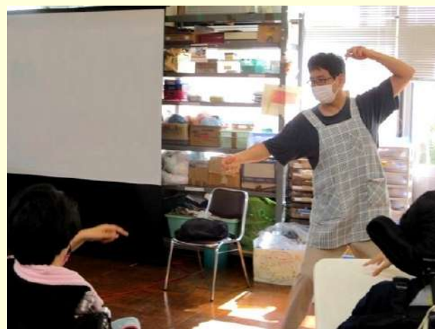
ジェスチャーゲーム これは何のスポーツかな？