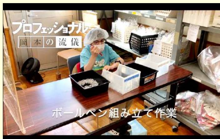
ボールペン組み立て作業