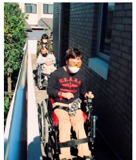
1階～2階の車いすでの移動は職員と一緒に外スロープで

今回は、エレベーターの改修整備工事が行われることになりました。外観的には大きな変化はありませんが、施設を安全に利用するための大切な工事となります。約1ヶ月間、皆様にはご不便、ご迷惑をおかけするかとありますが、何卒ご了承願います。