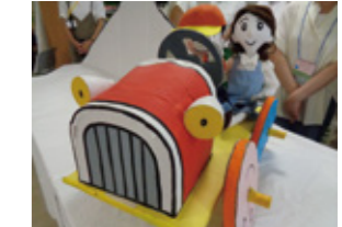
こひつじ幼稚園あすなろ会さん

こひつじシアターを上演した際、皆さんの喜ぶ姿を見て嬉しかったのが忘れられません!また一緒に楽しめるものを企画したいと思っていますので、楽しみにしててください。