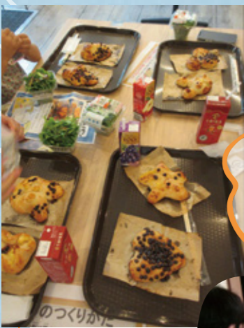
みんなでいただきます!