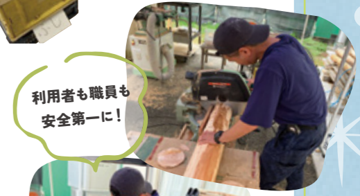
利用者も職員も安全第一に!