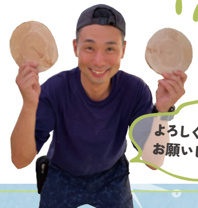
よろしく お願いします!