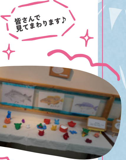
皆さんで見てください!