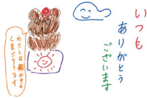
文・イラスト 保崎 祥子

みなさまからの温かいご寄付とボランティア活動に心より感謝申し上げます。またこのほかの方々の様々なご協力にも厚く御礼申し上げます。みなさまの支えが私たちの力となっています。