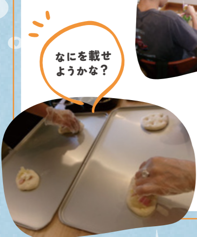
なにを載せようかな?

これからもいっちょうめパンの土曜日営業でパン作り体験を計画しています。皆様のご参加をお待ちしております!