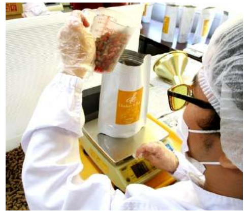
ふくろ ふくろ ていねい せいかく 1 袋 1 袋 丁 寧 に 正 確 に けいりょう 計 量 し て い ます

こんご じしん も さぎょう と く 今 後 も 自 信 を 持 っ て 作 業 に 取 り 組 ん で い きます。