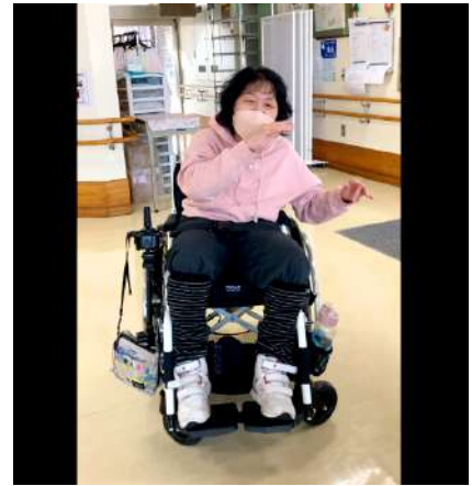
うた 歌もダンスも演奏も れんしゅう 練習がんばりました