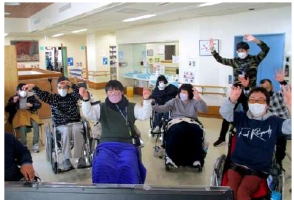
モニターを見ながら みんなで体操