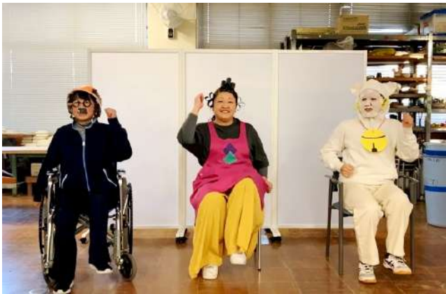
体操をする 波平さん、サザエさんと、タマ(!)