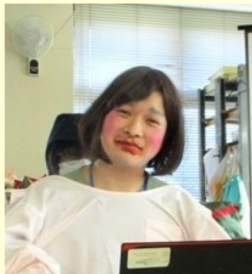
最新トレンド(?)のメイク完成