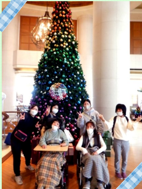
ひとあしはや きぶん 一足早く クリスマス気分♪