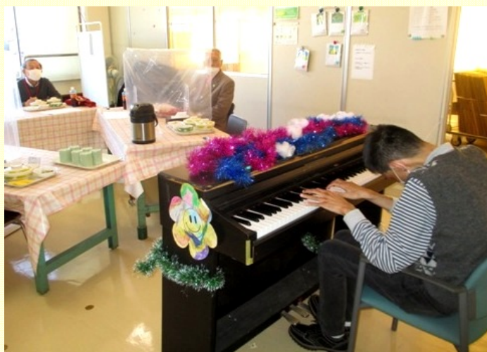
利用者さんのピアノを聴きながら ゆったりと会食を楽しみました