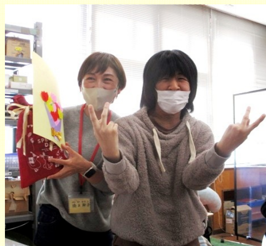
利用者さんから記念品の贈呈 そして一緒に記念撮影