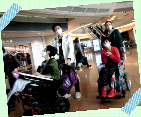
へいじつ ひと 平日でも人でいっぱいでした！