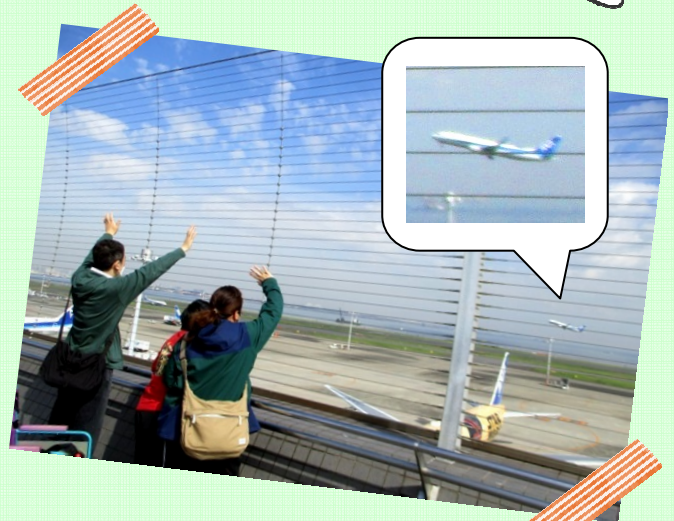
み ている あいだ ひこうき 見ている間にも飛行機が つぎつぎ と た 次々と飛び立っていく！