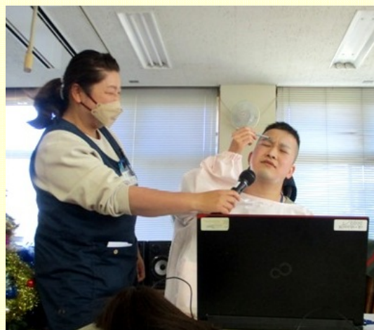
職員による二人羽織メイク講座

楽しい時間はあっという間で、日頃の感謝を伝える にはとても足りない時間でしたが、今後とも岡本ホー ムのご支援を賜りますよう、お願い申し上げます。