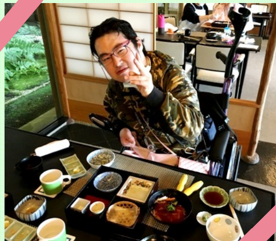
おいしい しょくじ まんぷく おいしい 食事で満腹 デザートもペロリ♪