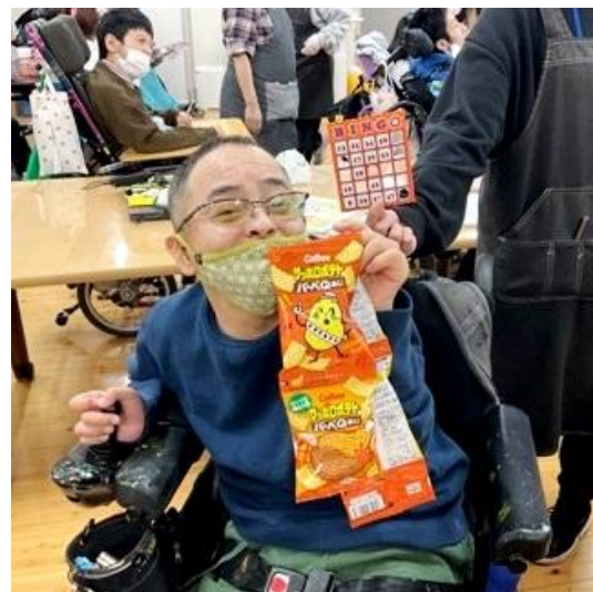
ひと ビンゴになった人から プレゼントをゲット！