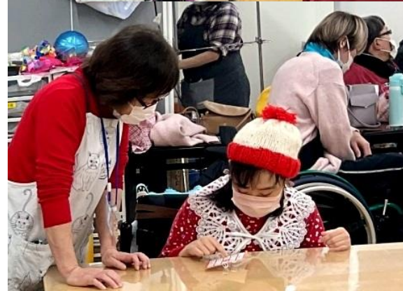
モニターに出る数字に ドキドキワクワク この数字こい！