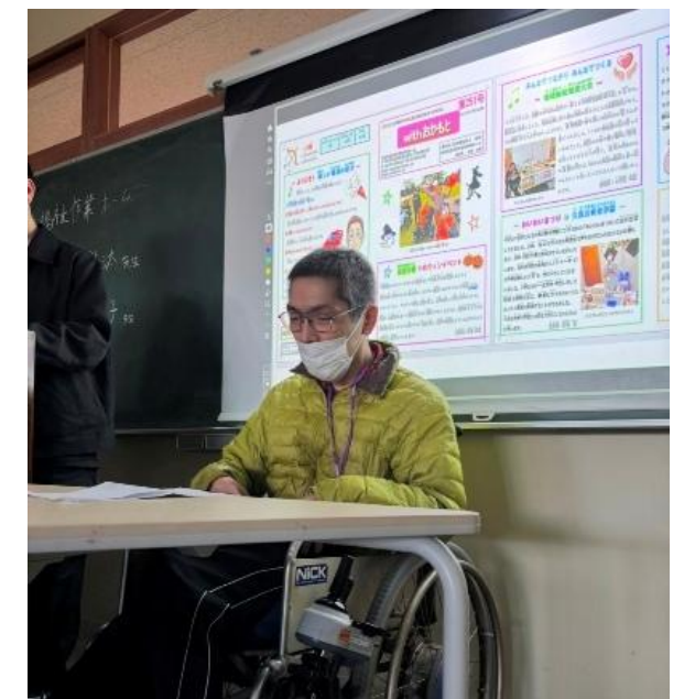
ウイズ 「withおかもと」の へんしゅう きぎょう せつめい 編集作業について説明しました