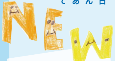
新しい場所での活動が始まりました

利用者の方にも、新しい施設の写真を見ていただきながら「ここで活動しますよ」「近くには、こんなところもあります」と説明し、少しずつイメージを持っていただけるようにしました。不安そうな表情だった方も「ちよつと楽しみかも」と言ってくれるようになり、職員も一安心ということもありました。 また、送迎バスのルートや駐車場スペースも変わるため、何度か試走を行い、時間や安全面をしっかりと確認しました。新しい施設の周辺には、散歩にぴったりな大きな公園もあり、自然の中でリフレッシュできる環境にも恵まれています。 もちろん、環境の変化に不安を感じている方もいらっしゃいますが、「変化＝マイナス」ばかりではないと考えています。新しい場所には、新しい発見や出会いがあります。今までとは少し違う環境が、職員や利用者の方一人ひとりの「できること」を広げるきっかけになればと願っています。 この仮の施設での半年間も、大切な「日常」です。元の施設に戻ったとき、「なんだかちよつと成長したね」と皆で笑いあえるような、そんな時間を一緒に作っていただけらと思っています。