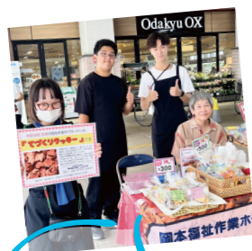
一緒にクッキー販売

実習生の皆様がそれぞれの場所で、玉堤分場での経験を活かしていただけたら、一同とても嬉しく思います。お互いに充実した時間を過ごせるよう、今後も実習生の受け入れを続けていきたいと思っています。