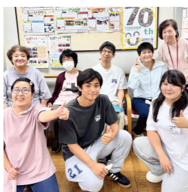
社会福祉士実習は約1か月！お別れ、さびしい！