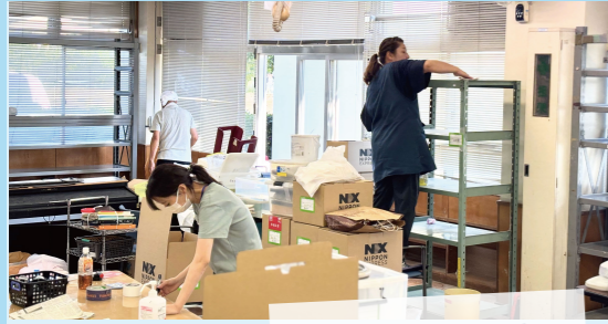
40年分の荷物を運び出しました