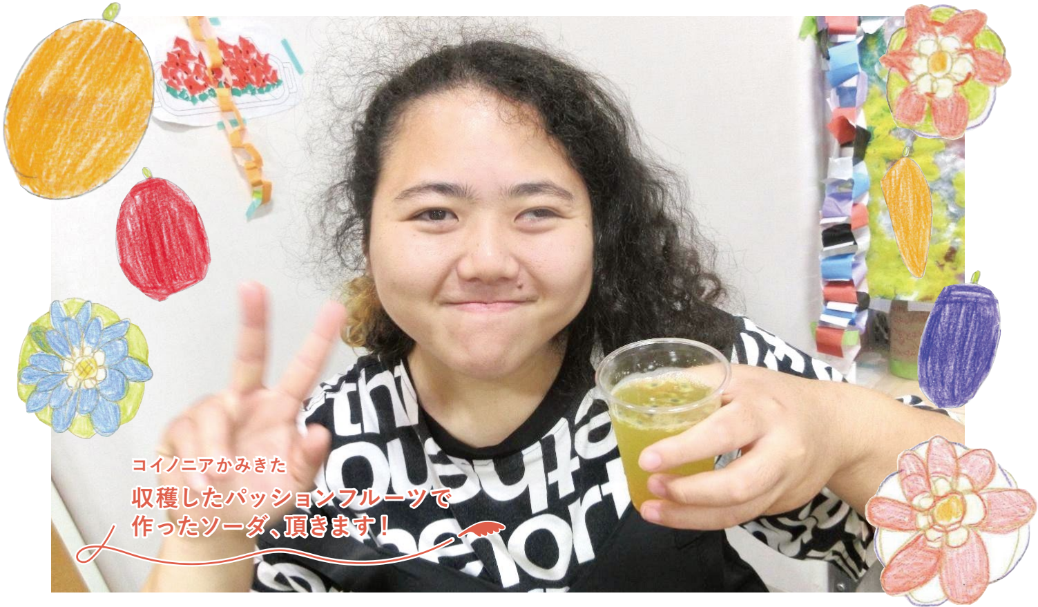
コイノニアかみきた 収穫したパッションフルーツで 作ったソーダ、頂きます!