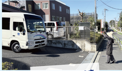
安全にバスの出入りを誘導します